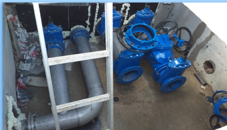
Réhabilitation hydraulique de la cuve n°1 de la Bataille - Chef Boutonne -

Pour ce qui concerne les travaux, ce tableau ne fait état que des chantiers réceptionnés et intégrables à l'actif au 31/12/2023.