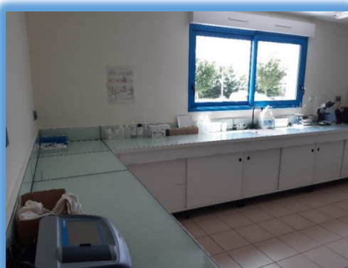
Le laboratoire d'analyse du Syndicat

La majorité des ressources exploitées par le syndicat sont concernées par des détections de chlorothalonil R471811, ce qui ne permet pas d'obtenir une mesure corrective efficace juste par mélange des eaux et ainsi revenir en dessous de la limite qualité sur les eaux traitées avant mise en distribution. Ceci a entraîné la mise en place d'une demande de dérogation auprès de la préfecture pour être autorisé à continuer à exploiter les ressources en attendant la mise en place d'une mesure corrective adaptée sur cette molécule.