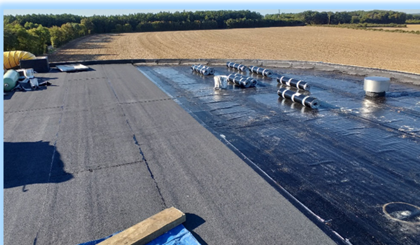
Reprise de l'étanchéité de la cuve n°1 de la Bataille - Chef Boutonne -