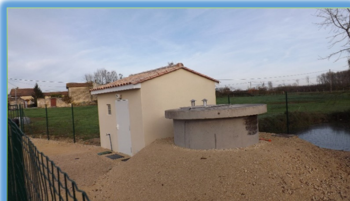
Le captage du Boulassier à Périgné

Le volume prélevé au cours de l'année 2023 a été de 2 142 788 m 3 en comparaison au volume 2022 qui était de 2 191 803 m 3 . Cela représente une baisse de 49 015 m 3 sur l'année 2023 après une baisse de 21 357 m 3 en 2022.